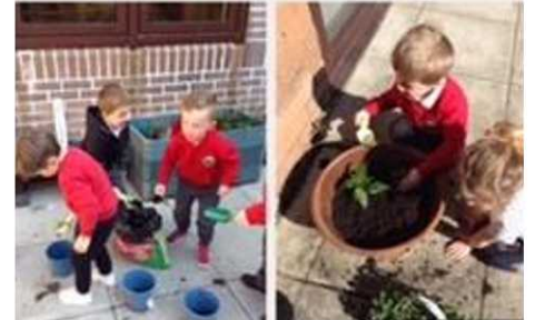
Prysur yn plannu blodau