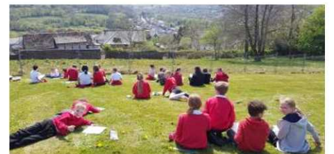
Arlunio'r olygfa o gaeau'r ysgol