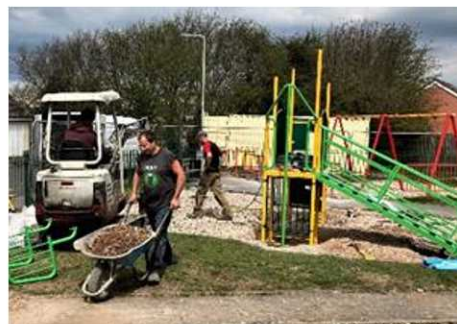
Y gweithwyr wrthi'n brysus yn gosod sylfeini'r offer newydd.

Dros yr wythnos nesaf, disgwylir y caiff y cae chwarae ym mhen pellaf Maes y Wennol, Ffordd Cefn yr Hendy, Meisgyn ei ailagor gydag amrywiaeth o offer newydd sbon fydd at ddant plant yr ardal gyfagos. Bu'n rhaid cau'r lle chwarae am ychydig amser oherwydd cyflwr peryglus y lloriau dan yr offer, ond manteisiwyd ar y cyfle i archebu a gosod offer newydd hefyd. Eisoes mae'r rhan fwyaf o'r offer yn ei le a'r cam olaf fydd gosod lloriau newydd. Hyderwn y caiff cenhedlaeth newydd o blant ifanc lawer o fwynhad o'r adnodd pwysig hwn.