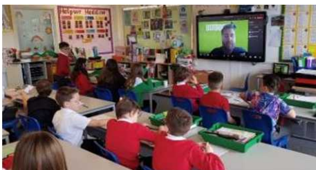
Cwis yr Urdd