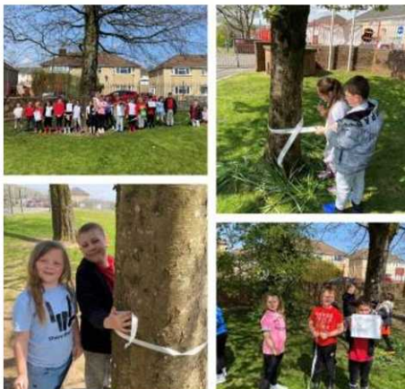
Mae mathemateg yn hwyl!