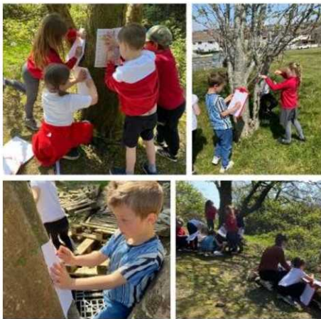
Gweithgareddau celf a gwyddoniaeth Bl1 yn y goedlan