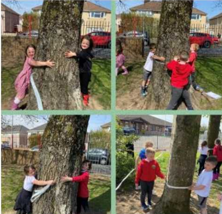
Bl2 yn mwynhau gwersi yn yr awyr agored

Cynhaliwyd nifer o weithgareddau i ddatlu wythnos Dysgu yn yr Awyr Agored a Diwrnod y Ddaear. Roedd y gweithgareddau amrywiol yn cynnwys mesur cylchedd boncyffion coed, mesur maint safle'r ysgol, arlunio yr ardal leol, chwilio am drychfilod a phlannu blodau. Roedd pawb yn cytuno fod dysgu yn yr awyr agored yn llawer o hwyl!