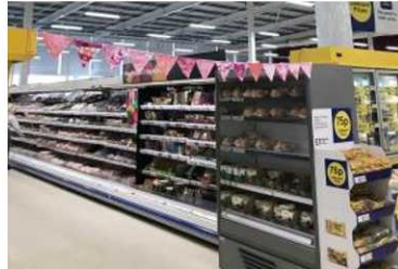
Rhai o faneri Bl 4 a 5 oedd i'w gweld yn Tesco