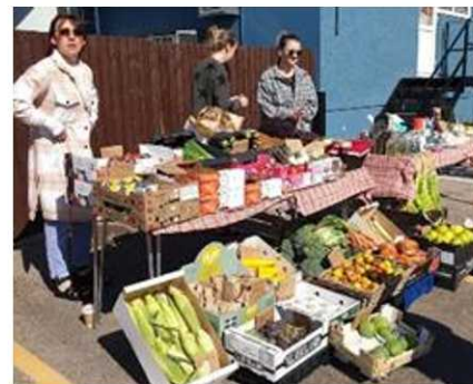
Un o'r stondinau niferus yn y farchnad.

Am 10 o'r gloch fore Sadwrn 24 Ebrill, ar ddiwrnod bendigedig o wanwyn, agorwyd marchnad awyr agored newydd Pont-y-clun am y tro cyntaf. Nod y datblygiad yw rhoi cyfle i fusnesau bach lleol dynnu sylw'r trigolion at eu cynnyrch. Braf oedd gweld nifer dda yn bresennol a gwerthiant calonogol i'r amrywiaeth o gynnyrch oedd ar gael, yn deisennau blasus, llyisiau ffres, bwyd y môr, crefftiau a llawer iawn mwy. Mae'r farchnad wedi ei lleoli yn y maes parcio ar bwys tafarn y Windsor, a'r bwriad yw ei chynnal ar ddydd Sadwrn olaf pob mis rhwng 10 y bore a 2 y pñawn. Cofiwch alw draw i gefnogi'r fenter newydd gyffrous hon.