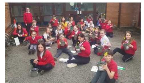
Prosiect Bylbiau'r Gwanwyn