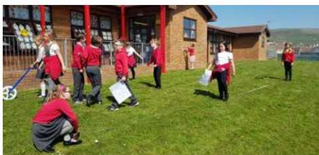
Mesur o gwmpas safle'r ysgol