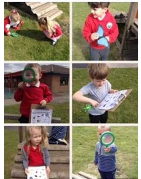
Y Dosbarth Meithrin yn chwilio am drychfilo