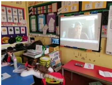
Cwis yr Urdd

Roedd hi'n ddiwrnod hapus iawn yn yr Ysgol ar ddydd Gwener Gwenu- crewyd cardiau diolch, emojis newydd, adrodd jôcs a cafwyd llawer o chwerthin!!