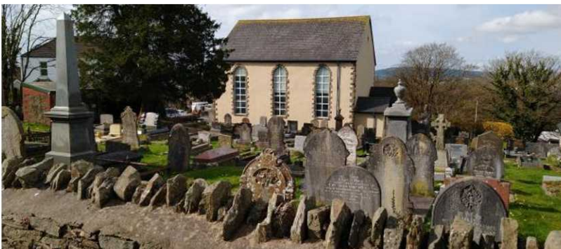
Tabernacl Efail Isaf a'r Fynwent