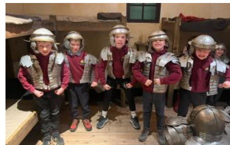
Ymladdwyr Rhufeinig Brawychus!