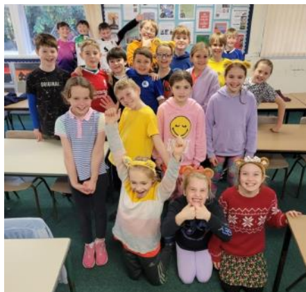
Mwynhau ar ddiwrnod Plant Mewn Angen!

Dathlon ni 'Plant mewn Angen' drwy wisgo dillad Ymarfer Corff smotiog a lliwgar i'r ysgol. Cawsom ddiwrnod llawn hwyl a sbri! Bu pob dosbarth allan ar yr