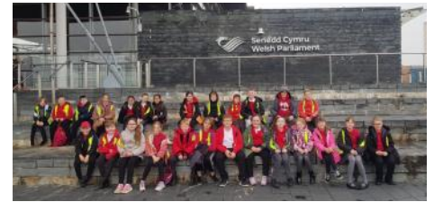
Blwyddyn 5 a 6 yn Senedd Cymru

I gadw golwg ar hynt a helynt y 'Valley Commandos' galwch mewn i wefan CR Pontypridd www.ponty.net neu ar y safleodd cymdeithasol @pontypridrfc