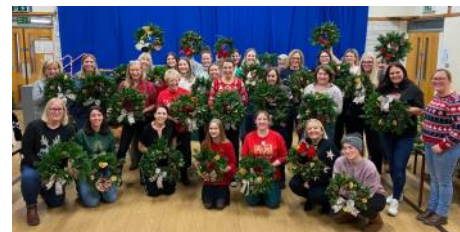
Noson Greu Torchau Nadolig