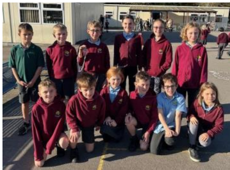
Llwyddiant yn Ras Traws Gwlad yr Urdd