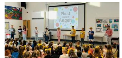
Llysgenhadon Hawliau Plant yn arwain gwasanaeth Diwrnod Plant Mewn Angen

Diolch i'r Llysgenhadon Hawliau Plant am gynnal gwasanaeth i sôn am waith Plant Mewn Angen yn y gymuned. Siaradwyd am hawliau plant a sut mae arian o'r elusen yn mynd i gefnogi'r hawliau hyn. Casglwyd swm o £245.45 ar y diwrnod, diolch yn fawr i bawb!