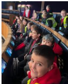
Bl 4 a 5 yn siambr Senedd Cymru

Fel rhan o'u gwaith ar Hawliau Plant fe aeth disgyblion Blwyddyn 4-6 ar ymweliad â Senedd Cymru ym Mae Caerdydd. Roedd pawb wedi dysgu llawer o'r ymweliad ac wedi mwynhau