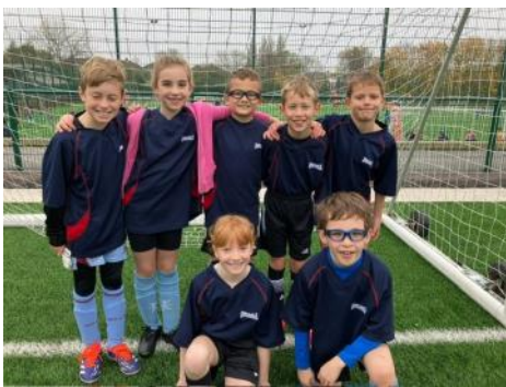
Tim Pel-droed Cymysg Blwyddyn 3 a 4