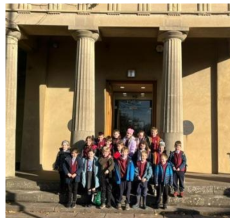
Dosbarth 3 yn mwynhau yng Nghaerllion

Ymwelodd disgyblion Dosbarth 3 a Class 3 ag Amgueddfa Lleng Rufeinig Cymru yng Nghaerllion. Cymeron nhw ran mewn gweithdy chwarae rôl a mwynheun nhw ymweld â'r Amffitheatr, Barics a'r Baddonau Rhufeinig. Roedd eu hymddygiad yn wych trwy gydol yr ymweliad - da iawn Blwyddyn 3.