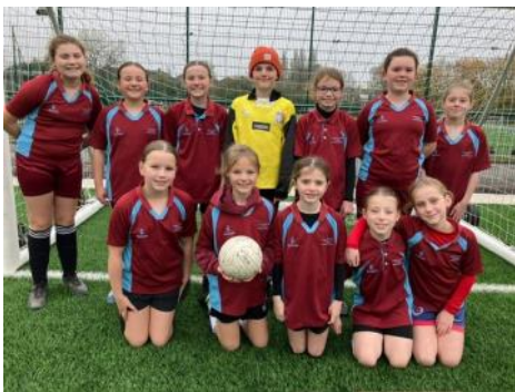
Tim Merched Blwyddyn 5 a 6