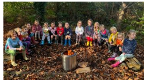
Dosbarth 2 yn mwynhau ar ddiwrnod Plant mewn Angen!

iard yn cymryd rhan yn sialens 'runPudsey'! Codwyd £529.40 – diolch i bawb am eu cyfraniadau!